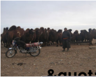
"Баянхонгор" хэсгийн 13 өрх