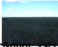
"Шилүүстэйн ус" хэсгийн 25 өрхийн төл малын бэлчээр