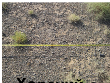
Хөрсний өнгөн хэсгийн хайрган хучлагат төлөв байдал