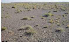
Хөрсний өнгөн хэсгийн хайрган хучлагат төлөв байдал