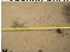
Хөрсний өнгөн хэсгийн сул элсээр хучигдсан төлөв байдал

Цэгцэрлэгтэй (24.4%), Үнэгтэй (21.9%), Дунд зэвэгтэй (22.8%), Сүл элсээр хучигдсан (22.8%), 25 (6%)